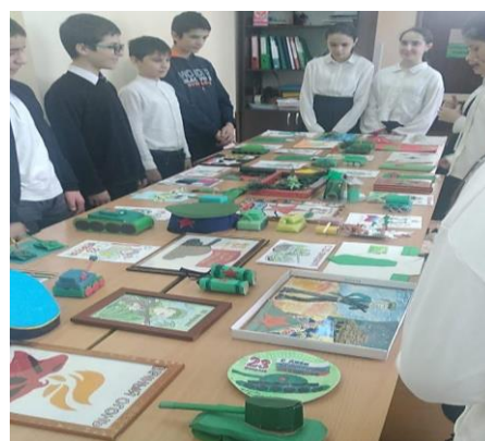
Выставка работ, посвященная 23 февраля