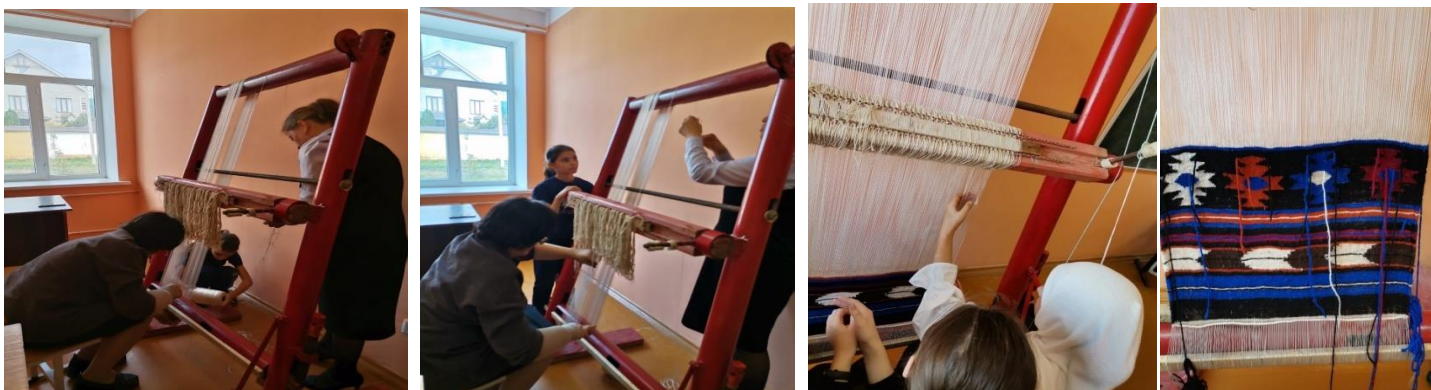
(рис.1 Натяжение основы на станок. рис.2 Деление нитей основы на передние и задние. рис.3.,4 Начало практической части изготовления паласа).